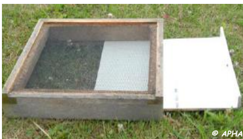
Photo 1 : Tiroir de fond de ruche associé à un plancher grillagé, utilisables pour le comptage de chutes naturelles de varroas