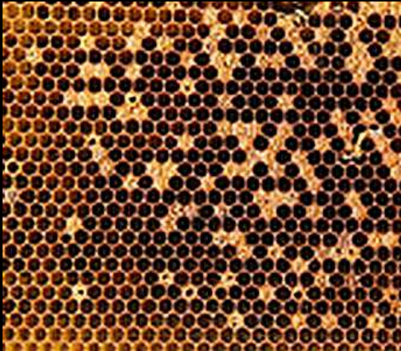
Couvain en mosaïque